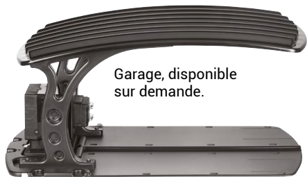
Garage, disponible sur demande.

Panneau de contrôle d'accès facile, il est très lisible et intuitif pour entrer des paramètres directement sur le robot.