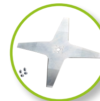
Protections latérales de l'unité de coupe intégrées dans la coque de support.

La lame de coupe en acier est silencieuse et les performances sont parmi les meilleures du marché quel que soit le type de gazon ou de terrain (36 cm).