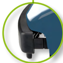
Pare-chocs avant mobile avec détection de collision et système de capteur d'obstacles efficace.

La charge par induction est disponible (sur demande) sur le modèle KS pour réduire l'entretien et prolonger la durée de vie de la batterie.