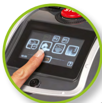
Bouton d'arrêt d'urgence.

Panneau de contrôle d'accès facile, il est très lisible et intuitif pour entrer des paramètres directement sur le robot.