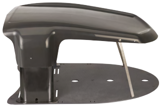
Toit de base de charge inclus

Coque mobile à 360° pour un impact de détection efficace dans n'importe quelle direction.