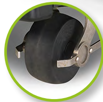
Roues avant inclinables, avec une mise à niveau automatique. Pour suivre parfaitement le relief du terrain, avec une forte traction même sur un sol accidenté. LIFT SENSOR : lorsque le robot est soulevé, le moteur de coupe s'arrête immédiatement.