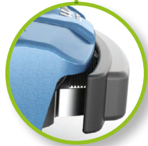
Pare-chocs avant mobile avec détection de collision et système de capteur d'obstacles efficace.