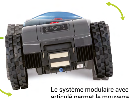
Le système modulaire avec bras articulé permet le mouvement indépendant des 2 parties du robot assurant ainsi une grande capacité de traction et un résultat de tonte inégalé.